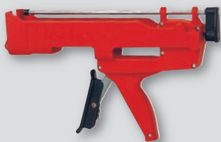
Auspresspistole FIS AK